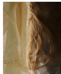
Détails d'œuvres de F. Loret et de M A. Franqueville