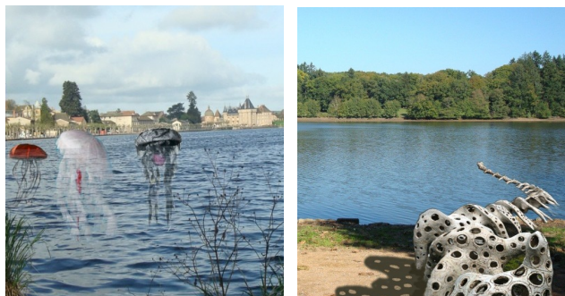
P. Rey, Méduses et A. Debizet, Dragon évolution

Le festival permet également à des œuvres exposées habituellement dans des lieux d'art réputés de la capitale de se déplacer en milieu rural. Ainsi, le visiteur rencontrera le Dragon Évolution d'Agnès Debizet pouvant s'étirer sur 200 m, faisant halte à La Clayette et les méduses de Pascaline Rey prenant les eaux à la campagne.